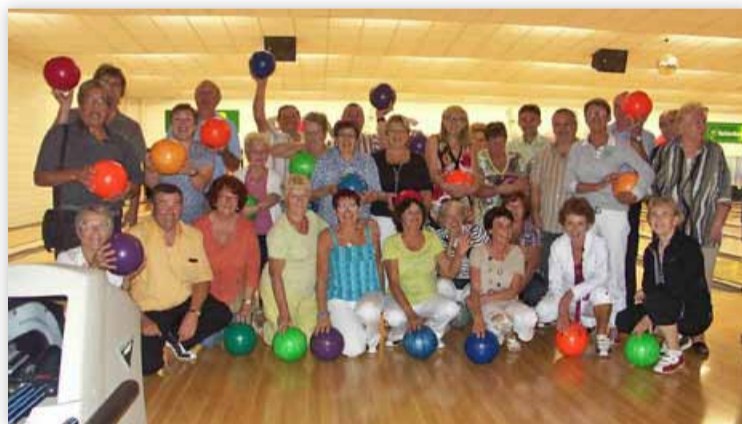
Le groupe au bowling de Mâcon