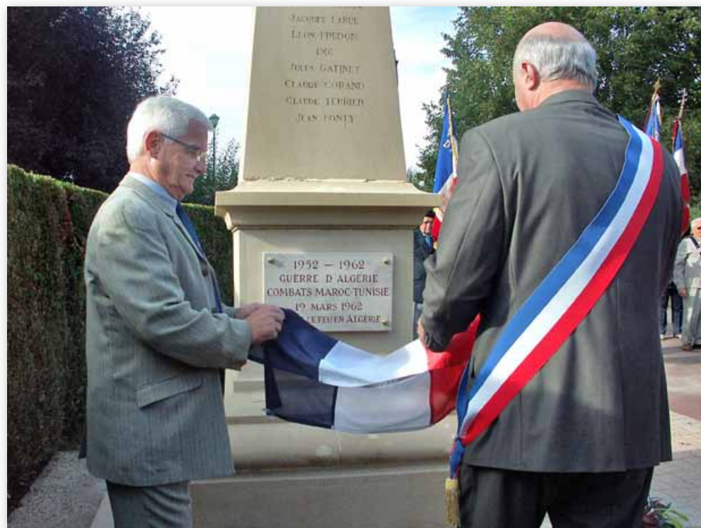
La plaque commémorative vient d'être dévoilée.

Un vin d'honneur offert par la Commune et le Comité local FNACA de SANCÉ a prolongé cette manifestation à la Salle des Fêtes.