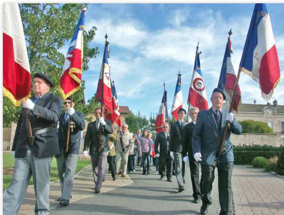
Pendant le défilé.