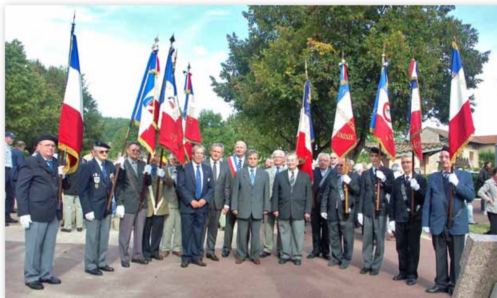
Les autorités et les porte-drapeaux devant le monument aux morts.