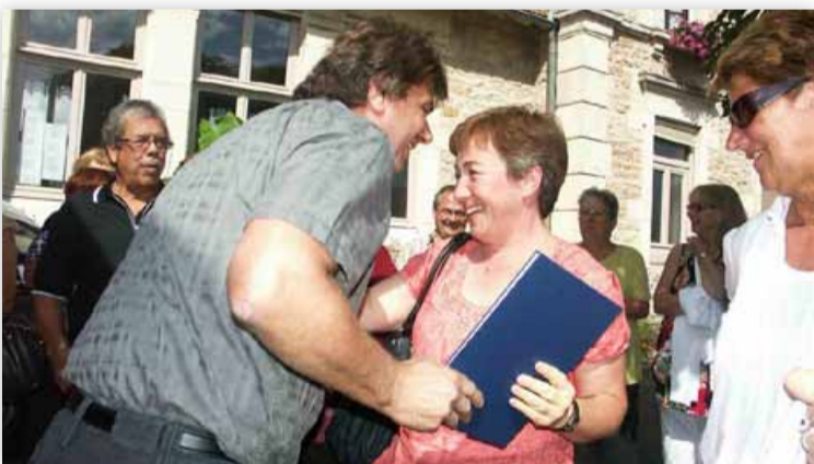
La bise des présidents des deux comités.

Les membres actifs souhaiteraient que d'autres personnes de SANCÉ se joignent à eux pour que perdure ce jumelage d'amitié, et pour que le groupe actuel soit encore plus solide.