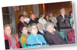
Une partie du public

Dans ses propos, le premier magistrat a rappelé les réalisations 2007, en précisant que tous les projets avaient été préparés en étroite collaboration avec les conseillers qu'il a sincèrement remerciés. Ensuite, en précisant que 2008 sera jalonnée par une étape importante de la vie républicaine : les élections municipales ; il a cité certains travaux déjà engagés ou programmés ; par exemple, l'aménagement du carrefour rue de Beausoleil - rue du Château du Parc avec enfouissement des réseaux aériens. Puis, il a évoqué les projets des futurs investissements étudiés en