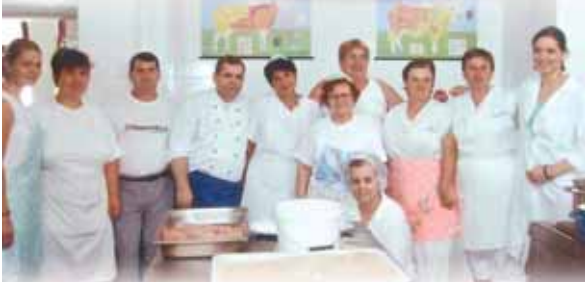
Une partie de l'équipe des cuisinières et cuisiniers roumains de l'hôtel-restaurant Doïna