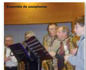
Ensemble de saxophones

Tous ces concerts sont gratuits, nous vous attendons très nombreux !! ■