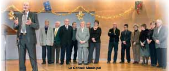
Le Conseil Municipal

Puis, pour clore cette agréable soirée, chacun leva son verre à la nouvelle année qui commence. ■