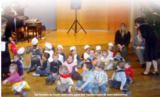
Les bambins de l'école maternelle avant leur représentation et leurs institutrices

Toute l'équipe municipale et les membres du C.C.A.S. présentent à toutes les Sancténies et à tous les Sancéens, leurs meilleurs vœux de bonne et heureuse année 2008 et surtout de bonne santé. ■