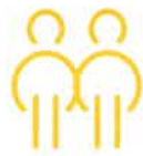
Chez les parents