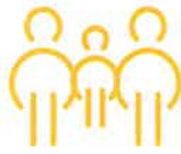
Dans les familles